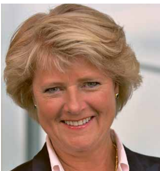
Monika Grütters (Staatsministerin für Kultur und Medien)

Am 7. Juni 2019 wird der Franz-Hessel-Preis von Monika Grütters, der deutschen Staatsministerin für Kultur und Medien, und Franck Riester, dem französischen Minister für Kultur, in den Räumen der Stiftung Genshagen verliehen.