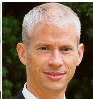
Franck Riester (Französischer Kulturminister)